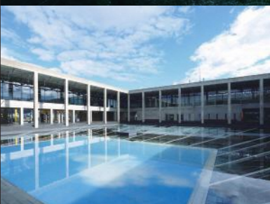
林德羅·厄利什「Palimpsest」

十日町的風貌由豐沛的降雪塑造，並由此衍生出服飾、飲食、建築、節慶與美學等領域的獨特傳統。這片自繩文時代中期便有人類棲居的區域，四季更迭間，遊客的每一次到訪都能獲得新的體驗。