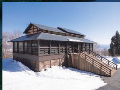
詹姆斯·特瑞爾「光之館」