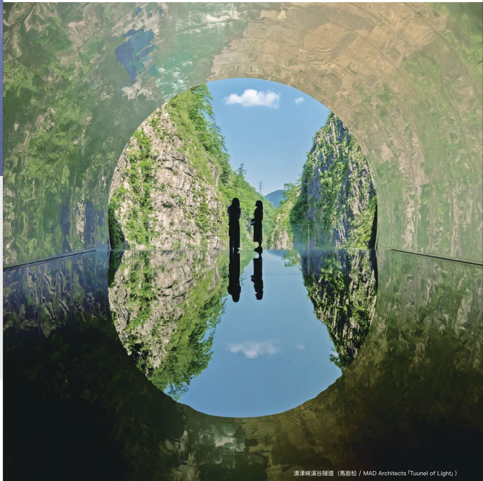
清津峽溪谷隧道 (馬岩松 / MAD Architects「Tuunnel of Light」)