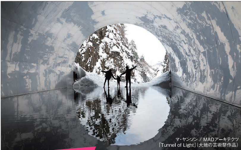
マ・ヤンソン / MADアーキテクツ 「Tunnel of Light」(大地の芸術祭作品)