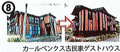
⑧ カーレンクス古民家ゲストハウス