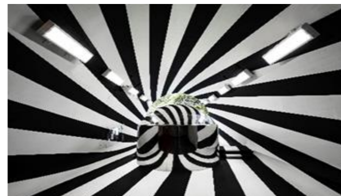
マ・ヤンソン/MADアーキテクツ「Tunnel of Light」