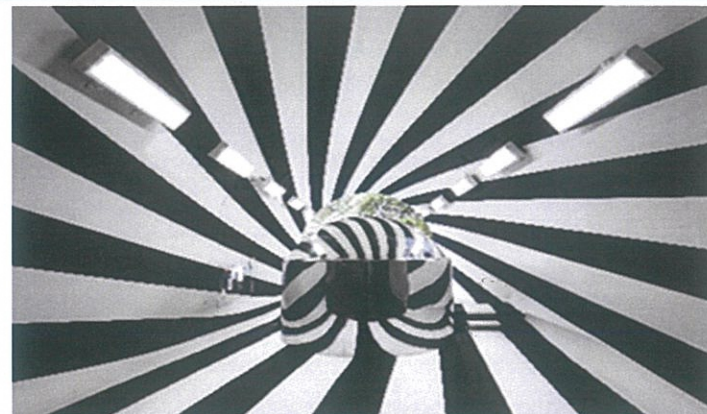
マ・ヤンソン/MADアーキテクツ「Tunnel of Light」