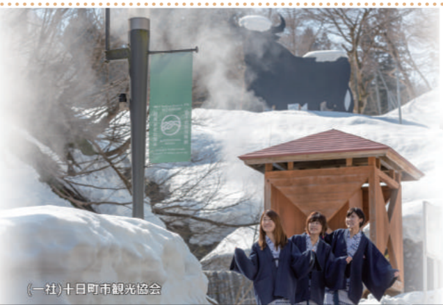
(一社)十日町市観光協会

6 「日の出家」 アゴだしのいい香りが食欲をそそるスープが特徴。つけ麺や丼ものなどメニューも豊富です。 【営業時間】 11:00～14:00、17:00～21:00 【電話番号】 025-596-2491 【定休日】 第2、第4木曜日