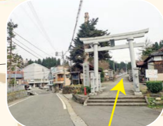
宮本茂十郎碑 A (宮本公園内)