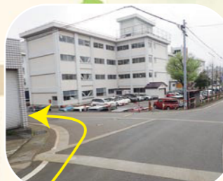
十日町服飾専門学校