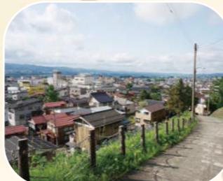
坂の上からの眺め