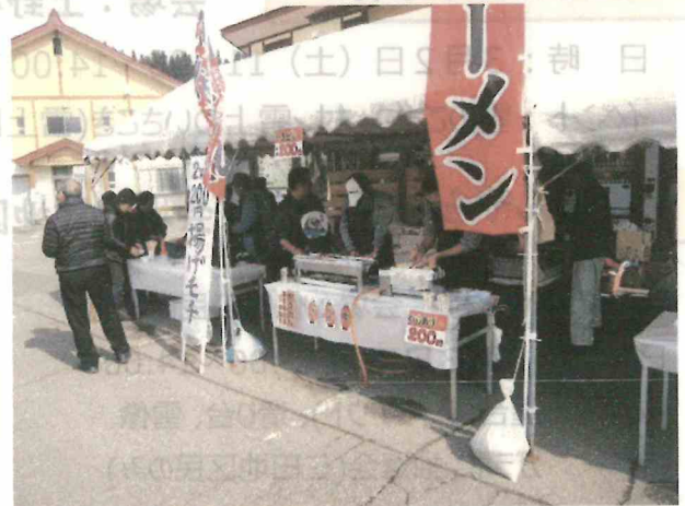
山田村地域振興会