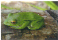
モリアオガエル(アマガエル科)