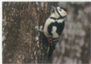
アカゲラ(キツツキ科)