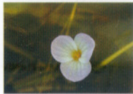
ミズオオバコ(トチガミ科)