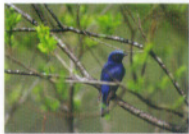
オオルリ(ヒタキ科)