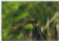
アキアカネ(トンボ科)