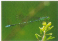
セシジイトンボ(トンボ科)