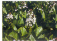
ミツガシワ(ミツガシワ科)