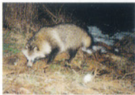
ホンダタヌキ(イヌ科)