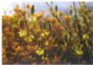
オオバクロモジ(クス/キ科)