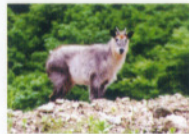
ニホンカモシカ(ウシ科)